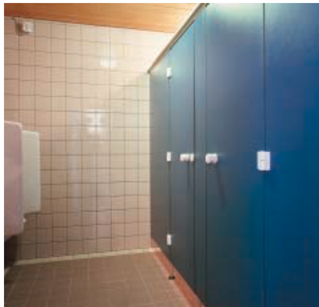
Cabines Rogapal® sur pieds d'aluminium anodisés naturel