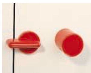
(3) Poignée et verrou de fermeture à l'intérieur de la porte