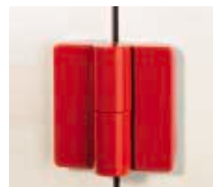
(2) Charnière en nylon avec noyau en acier