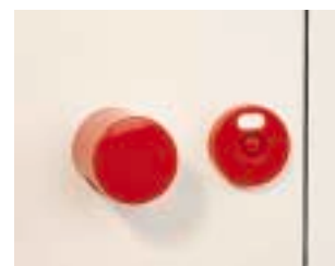
(4) Poignée et voyant libre/occupé à l'extérieur de la porte muni d'une décondamnation par carré

Profilés: aluminium anodisé ou époxy dans les coloris RAL idem ci-dessus.