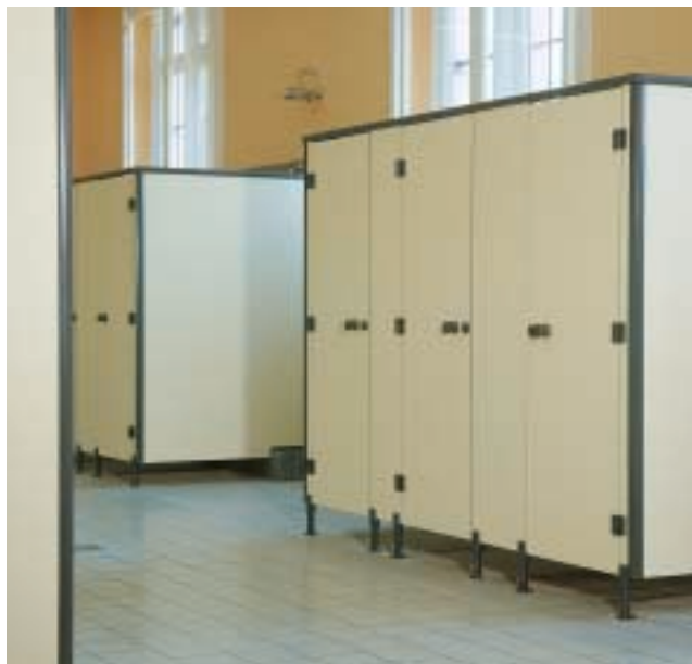
Cabines Rogapal® sur pieds en nylon