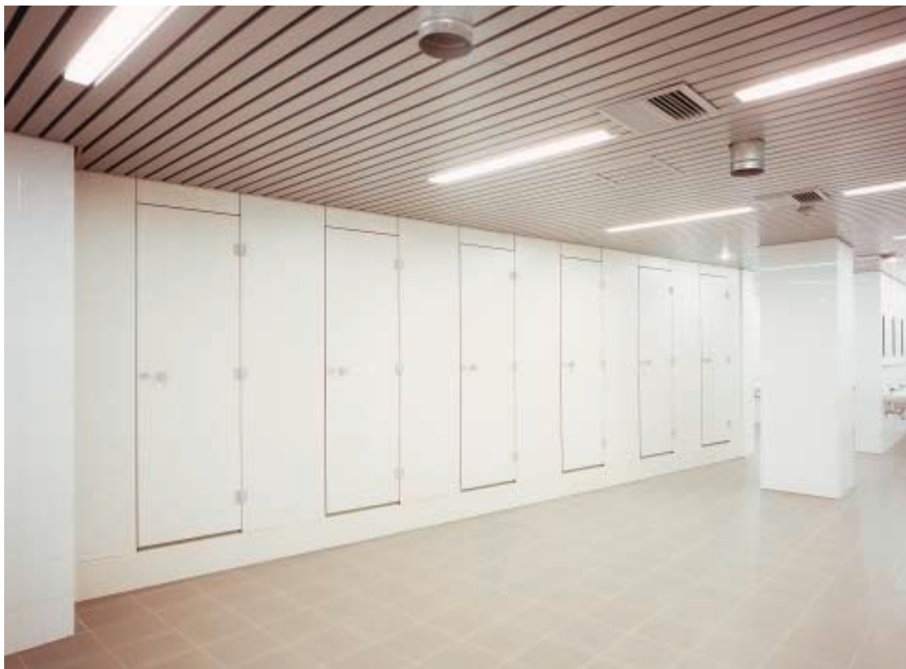
Cabines de douche avec paroi fermé sur toute la hauteur sur un sol de douche surélevé en polyester; référence: Parlement Européen, Bruxelles, Belgique