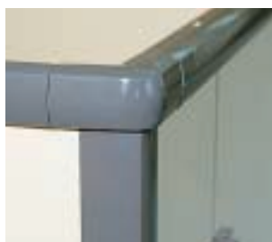
(1) Profilé stabilisateur et profilé vertical avec angles arrondis

Quincaillerie: rouge (RAL3003), blanc (RAL 9016), noir (RAL 9005), gris anthracite (RAL 7043).